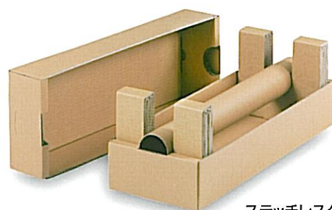
ステッチレスタイプ